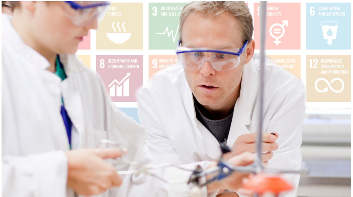
Figur 1. Globala frågor viktiga för elever.