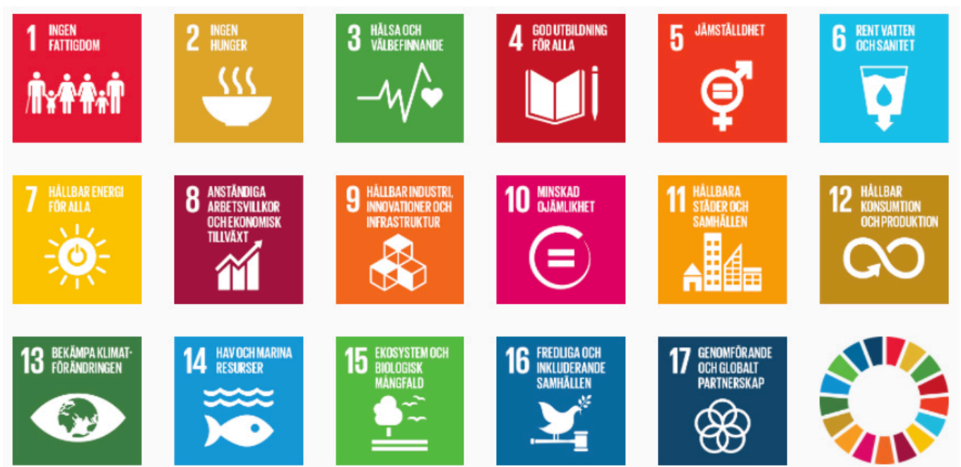
Figur 1. FN:s globala mål för en hållbar utveckling.

Studien [1] undersöker utbildningens roll för elevers lärande i frågor om hållbar utveckling. Resultaten visar att utbildning om hållbar utveckling ger effekt på elevers kunskaper, attityder och beteenden. Men den pekar också mot att undervisning om hållbar utveckling inte är särskilt vanligt i den svenska skolan.