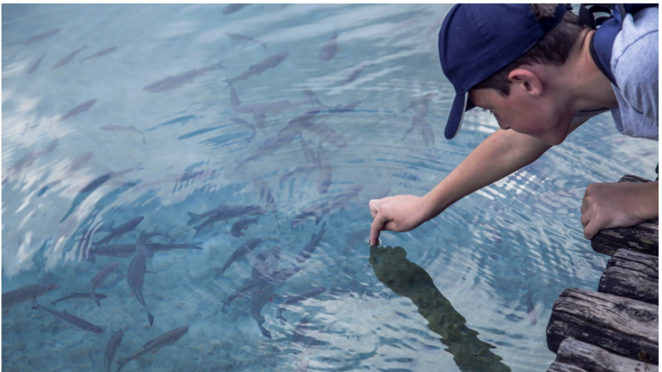
Figur 1. Det kan finnas höga halter miljögifter, som dioxiner och PCB, i fisk från Östersjön.

Forskarna menar att elevens sätt att tolka informationen reflekterade skillnader i värdebaserade övertygelser. Detta gjorde att olika elever i vissa fall kunde använda samma information till stöd för motsatta ställningstaganden. En slutsats av detta är att värderingar påverkade vilken innebörd samma information fick för olika personer.